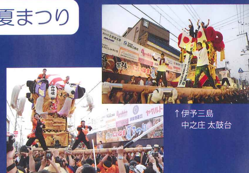
↑伊予三島 中之庄 太鼓台