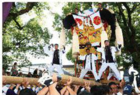
2019年新居浜太鼓祭り「一宮の社ミュージアム」

来年、安心して太鼓台のさしあげを皆さんと力を合わせて行えるときがきましたら、これまで以上に勇壮華麗な演技を披露したいと思いますので、どうかその際には、皆さまの変わらぬお力添えをいただきますよう、お願い申し上げます。